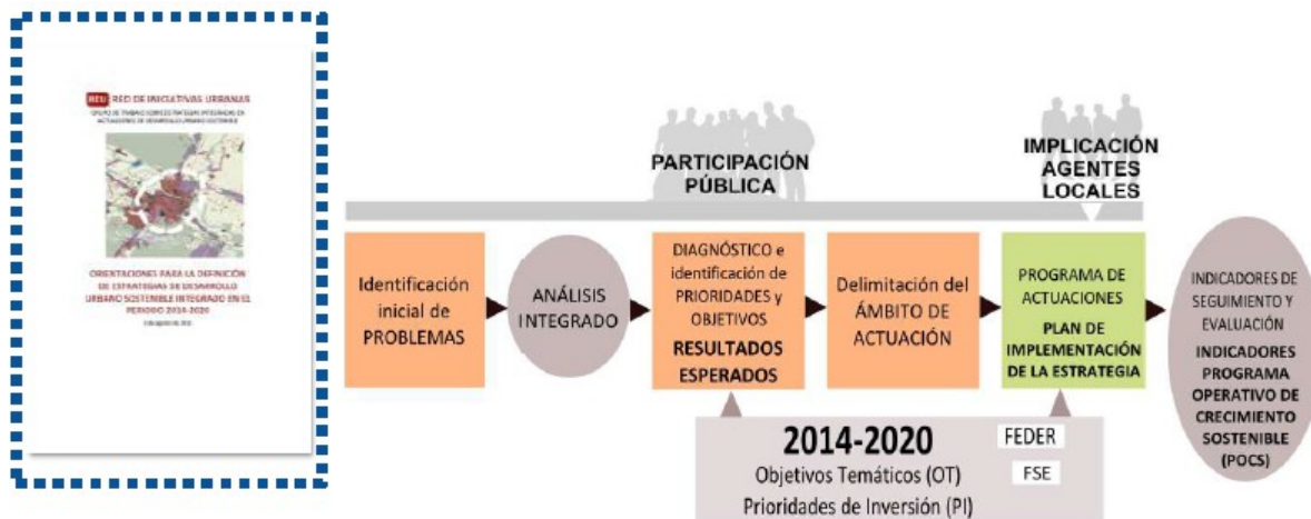
Diagrama orientativo de desarrollo de la estrategia de desarrollo urbano sostenible integrado

Orientaciones para la Definición de Estrategias de Desarrollo Urbano Sostenible Integrado en el periodo 2014-2020 (Red de Iniciativas Urbanas, 2015)