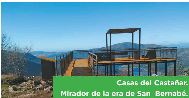
Casas del Castañar. Mirador de la era de San Bernabé.

El mirador del Valle del Jerte, ubicado en el paraje de la era de San Bernabé de Casas del Castañar, cuenta con una de las mejores panorámicas de este espacio natural, motivo por el cual se ha realizado esta intervención, que va a contribuir a establecer una red de Miradores Experienciales con las inversiones de la EDUSI y ampliar la oferta de espacios de observación paisajística en el entorno de Plasencia e incrementar el número de visitas turísticas. La actuación incluye una rampa de acceso hasta una plataforma rodeada por una barandilla y con un pequeño tejado en el centro. Su desarrollo ha contado con un presupuesto de 54.111,80 euros.