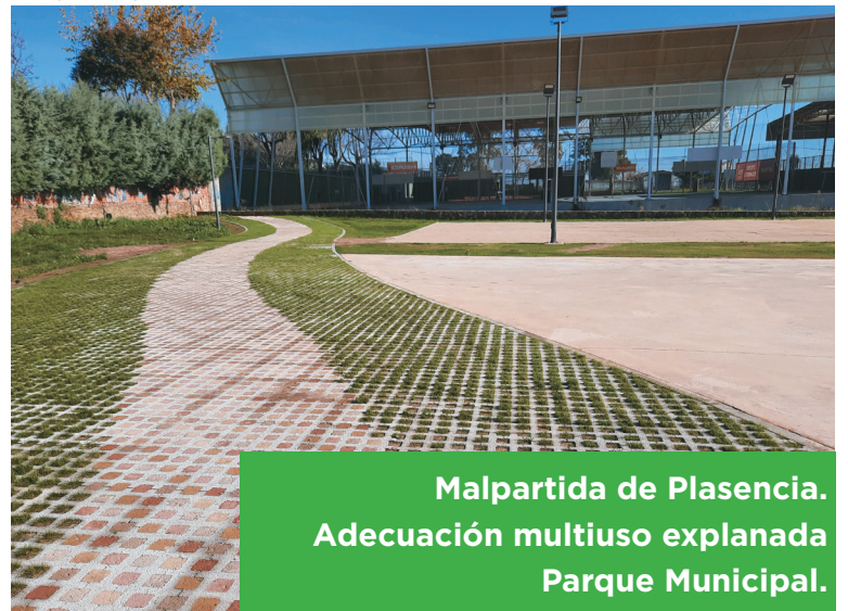
Malpartida de Plasencia. Adecuación multiuso explanada Parque Municipal.

Su presupuesto ascendió a 458.515,12 euros.