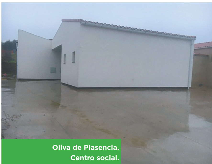
Oliva de Plasencia. Centro social.

la consolidación de los comercios existentes basado en la calidad, la diferenciación, la gestión eficiente y la cooperación entre sectores.