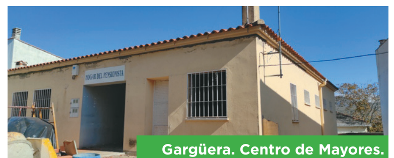
Gargüera. Centro de Mayores.

Esta actuación ha sido desarrollada con el objetivo de luchar contra la exclusión social y la pobreza dentro de la línea de actuación cinco: plan de innovación social, "servicio para todos". El espacio cuenta con un salón de uso múltiple dotado de pantalla y elementos de proyección audiovisual, una sala de podología, una sala de ejercicios básicos de rehabilitación y fisioterapia, así como una cocina y aseos. Su ejecución supuso una inversión de 83.697,66 euros.