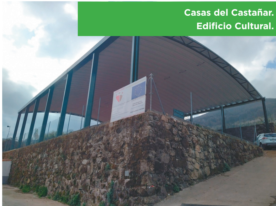
Casas del Castañar. Edificio Cultural.

Partiendo de un análisis de las debilidades, amenazas, fortalezas y oportunidades del sector se han planificado una serie de acciones destinadas a revertir la tendencia en el medio rural a través de medidas enfocadas a crear una situación óptima para