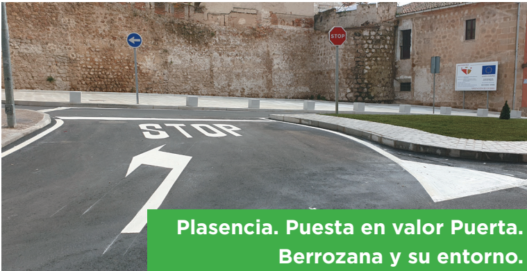
Plasencia. Puesta en valor Puerta. Berrozana y su entorno.